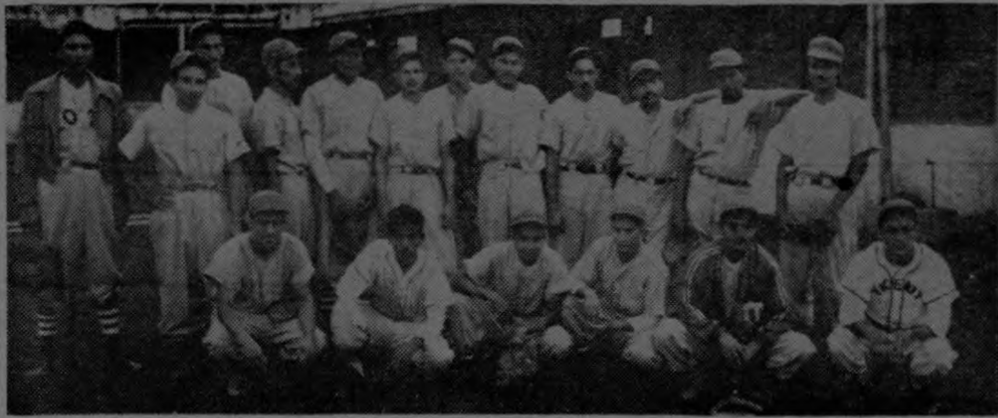
La novena de Unifruitco que cumplió pálida serie en el Parque de Beisbol Antonio Escarré.