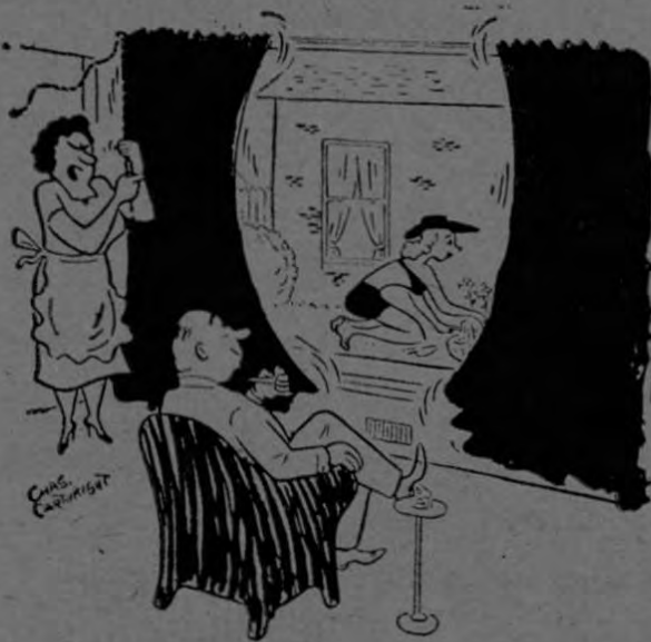
—¡Habrá un breve intermedio para almorzar!...