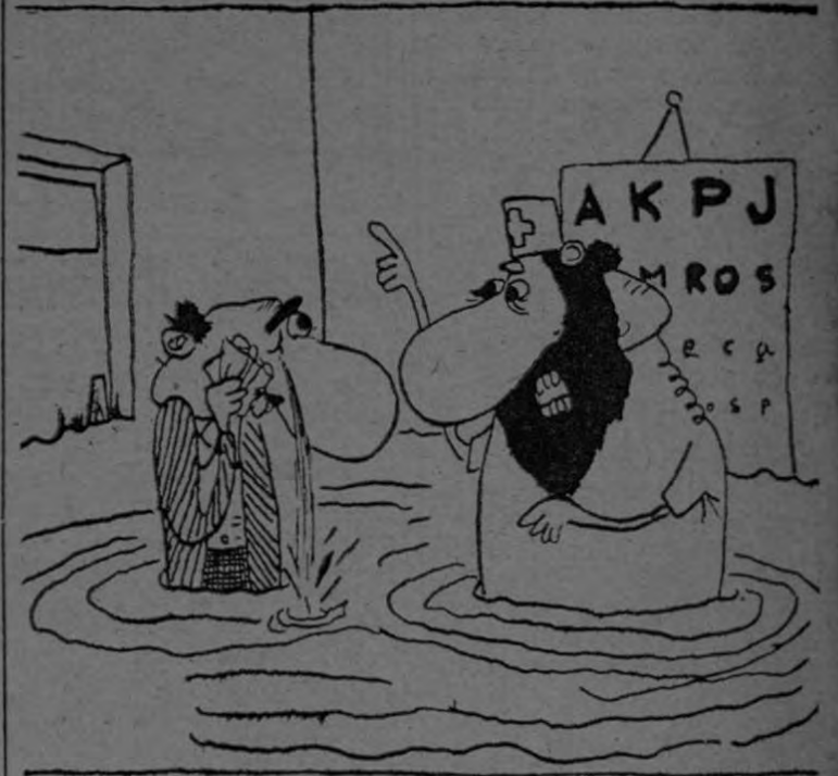
Ahora se convence que tiene catarata.